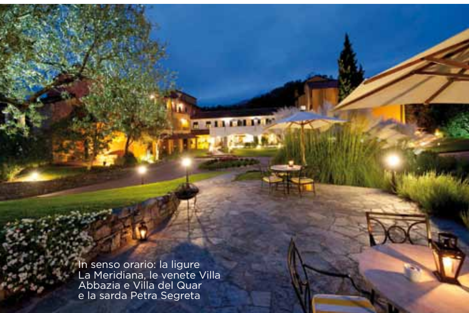
In senso orario: la ligure La Meridiana, le venete Villa Abbazia e Villa del Quar e la sarda Petra Segreta