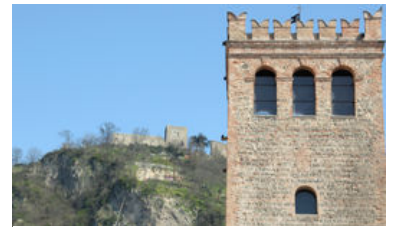
A caccia di fantasmi nei castelli del padovano